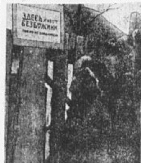
«Попов не принимаю». Плакат на избе бедняка. С. Александровка, Новомосковск. р.

Не пора ли взять дьячка на веревочку. ОТРЯД ЮП № 13.