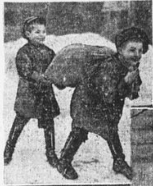
Сортируем семена бедняков.

издания декрета об урожайности и, более двух недель после решения Центрального комитета комсомола о походе за урожай, а до нашего, татевского, пионерского отряда, Смоленск. губ., Бельского уезда, еще не докатились эти важные указания ЦК комсомола.