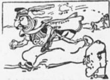
ЧЕМБЕРЛЕН:—Плакали мои денежки!

Англия пошла, что деньги, данные Баче-Сакао, зря потрачены.