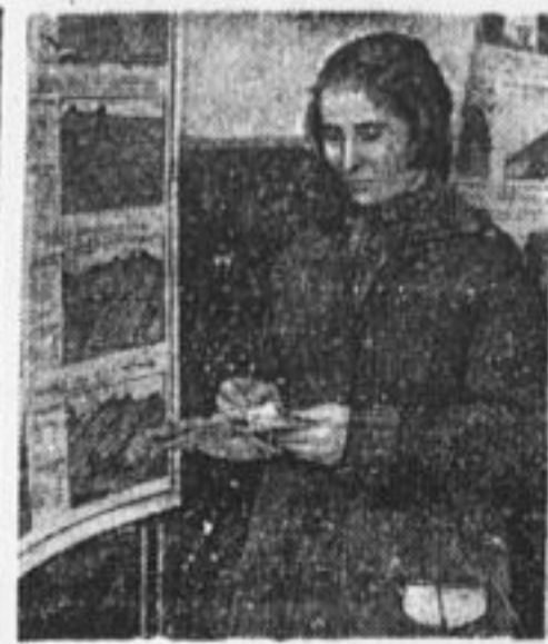
На выставке по поднятию урожайности.